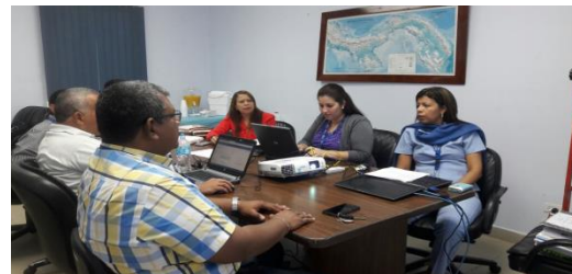
Reunión de Comité de Laboratorio de Ensayo, el 5 y 19 de Abril.