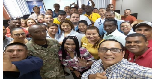
Seminario “El Buen Líder”, el 7 de abril.