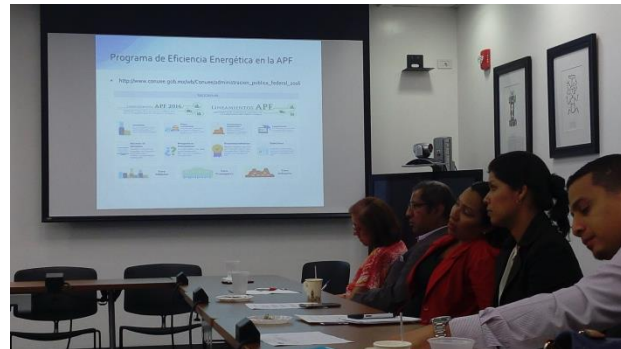
Taller del BID – Eficiencia Energética – 20 y 21 de Abril