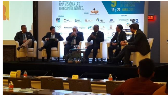
Simposio de Energía – 19 y 20 de Abril