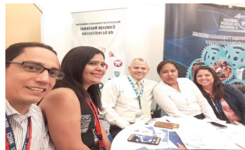
Simposio de Energía – 19 y 20 de Abril