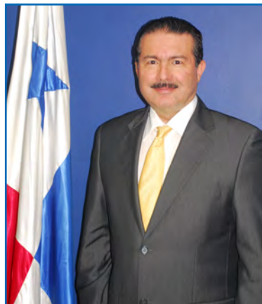
Su Excelencia Roberto Henríquez Ministro de Comercio e Industrias