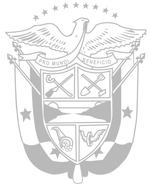
Excelentísimo Señor Ricardo Martinelli Berrocal Presidente de la República de Panamá